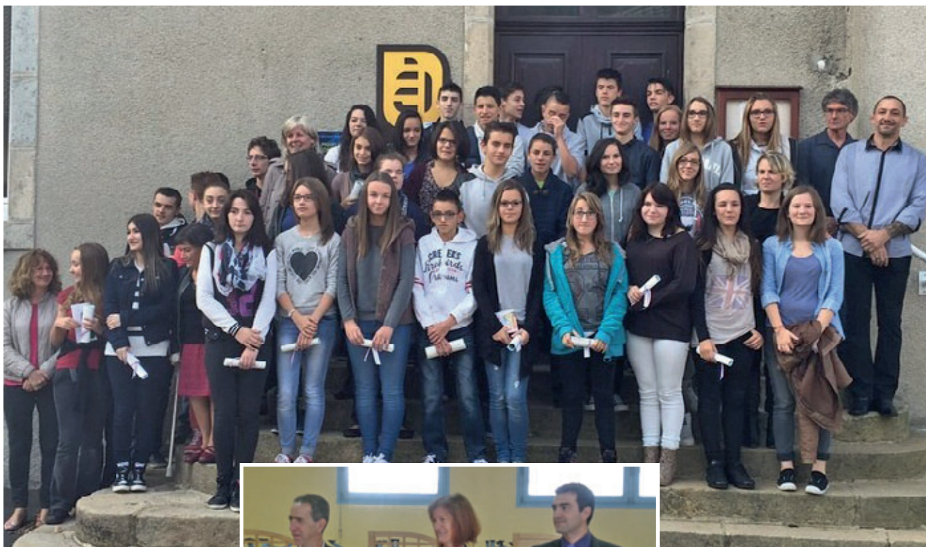
Les diplômés 2015 et leurs enseignants