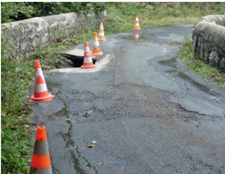
Pont au Grisard avant