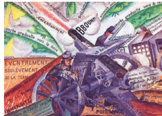
Gino Severini, Canon en action