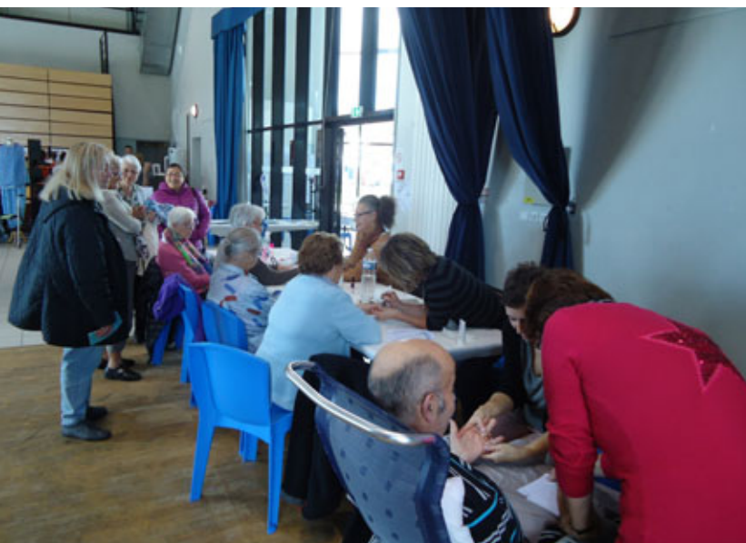
Atelier «Prendre soin de soi»

▶ L'utilisation de tablettes tactiles, de jeux de mémoire, d'expériences de découverte d'odeurs, de goûts ou de bruits les yeux bandés, auront permis de présenter les services proposés par l'ASA sur l'ensemble des communes ardéchoises : services de soins infirmiers à domicile, équipe spécialisée Alzheimer, portage de repas et aide à domicile.