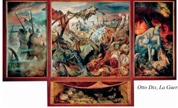
Otto Dix, La Guerre