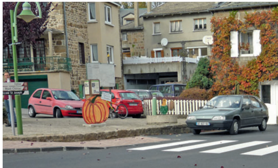
Abaissement du trottoir pour personnes à mobilité réduite