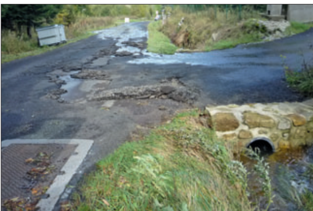
Le Pont avant